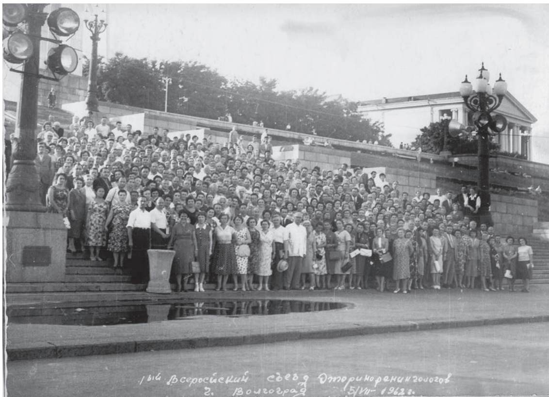
1-й Всероссийский съезд оториноларингологов. Волгоград. 1962 г.