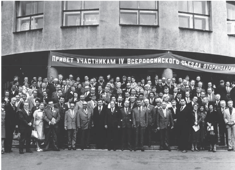
4-й Всероссийский съезд оториноларингологов. г. Горький, 1978 г.

оториноларингологической помощи населению России, подготовке научных и практических кадров, развитию сурдологии, слухопротезированию и фонологии.