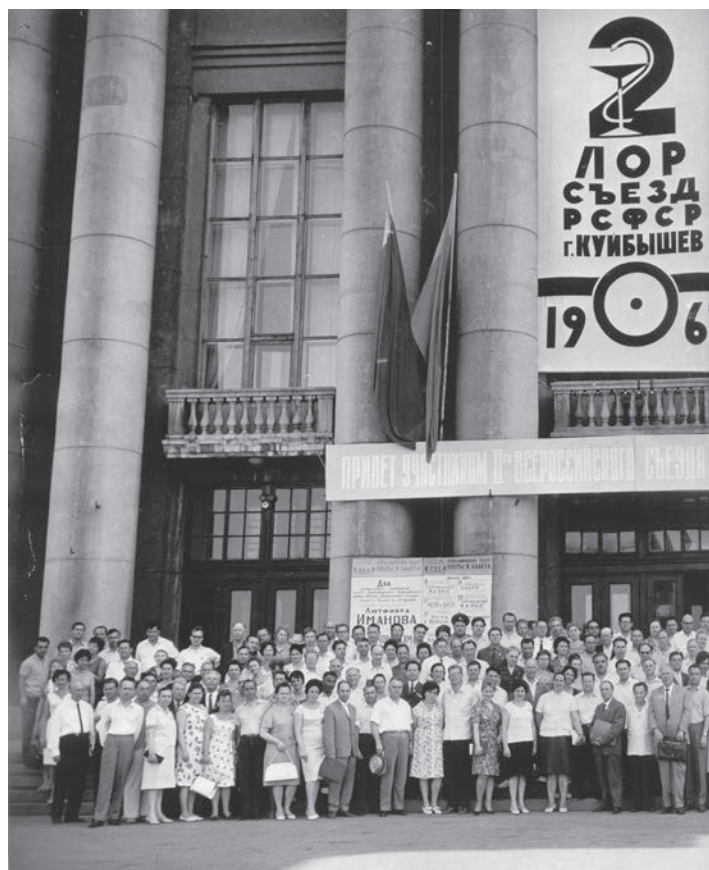
2-й ЛОР-съезд РСФСР. г. Куйбышев. 1967 г.