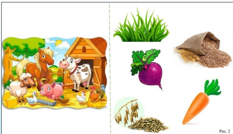
Рис. 1. Пример задания из диагностического альбома «гл+сущ в тв.п.» без предлога

Второй блок. Обследование усвоения глагольных словосочетаний на модели «глагол + существительное в предложном падеже» с учетом выражения грамматической связи слов с помощью предлога.