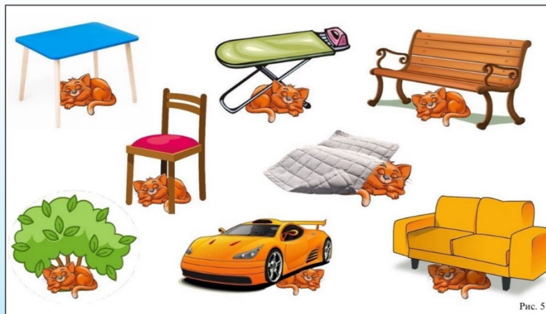
Рис. 2. Пример задания из диагностического альбома «гл+сущ в тв.п.» с предлогом «под»