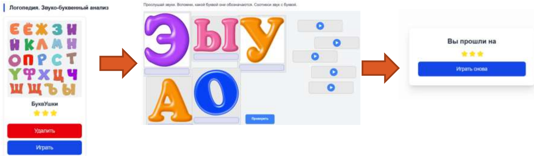
Рисунок. Пример игры, направленной на коррекцию нарушений письменной речи в компьютерном конструкторе.

Разработанные игры размещены в компьютерном конструкторе, использование которого предоставляется в свободном доступе всем пользователям: педагоги имеют возможность разрабатывать собственные игры по заданному шаблону; обучающиеся выполнять игровые задания. Пример одной из игр представлен на рисунке.